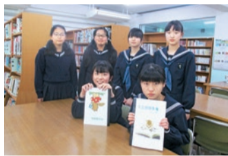
▲学習発表会で作品を発表しました

私たちが、荒川五中の文芸部は、2年生2人、1年生4人の計6人で活動しています。毎週火曜日と木曜日に、タブレットPCを使って物語の作成を行っています。制作した物語は、1月に行われる学習発表会展示の部で作品集として発表しています。私たち文芸部員は、最初はほとんどが初心者です。なので、どうやって物語を作ったらいのか分からず、活動時間のほとんどを何も書かずに過ごしてしまふ事もありました。けれど、活動を重ねるうちに、全員が個性ある作品を書き上げる事ができるようになりました。今は、物語の質を上げていく事が目標です。言葉と言葉のつなげ方を工夫したり、