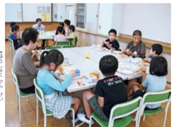
▲「ふれあい給食」で地域の方と交流を深めています

赤土小学校は学校の目の前に日暮里・舎人ライナーが走っている、東京都で唯一、電車の駅名になっている小学校です。