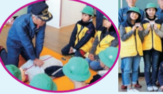
▲参加者全員が無事認定証を受け取りました

尾久西小ジュニア防災クラブの4・5年生10人が、東京消防庁の「救命入門コース」を受講。人工呼吸や胸骨圧迫、AEDの操作など、救命救助の流れを尾久消防署員の方に教わりながら、一人一人真剣に取り組みました。受講後は、修了認定証を一人ずつ手渡しされ、「これからは、倒れている人がいたら声をかけて助けたい」と力強く話しました。