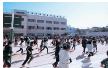
▲AKDスポーツタイムで持久走に取り組んでいます

①AKDスポーツタイム 週一回、全校児童で運動をする時間があり、持久走や長なわ、短なわを行っています。個人でカードに記録を残したり、クラスごとに回数を競い合ったりして、楽しく運動に取り組んでいます。 ②交流タイム 縦割り班活動の中に「なかよし読書」があります。低学年、高学年が互いに読み聞かせを行い、交流を深めています。