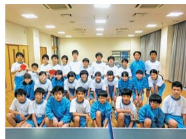
▲レッツゴー卓球部