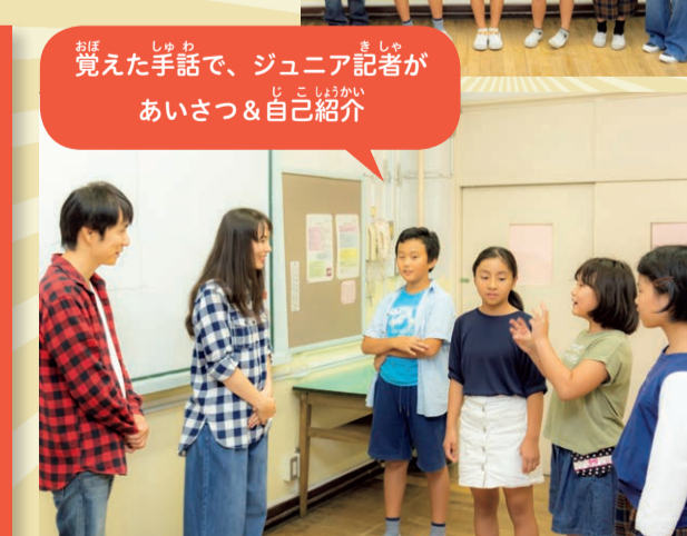
覚えた手話で、ジュニア記者があいさつ&自己紹介