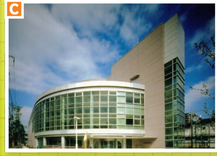
▲荒川ふるさと文化館・南千住図書館