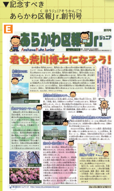
▼記念すべき あらかわ区報Jr.創刊号