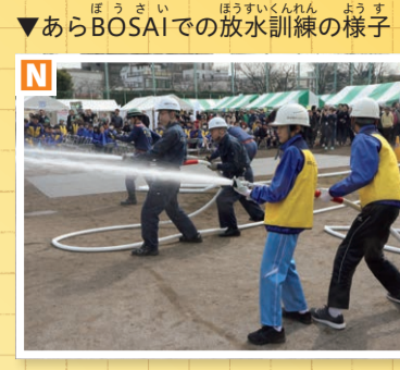
▼あらかわBOSAIでの放水訓練の様子