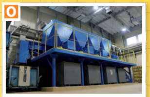
▲あらかわりサイクルセンター