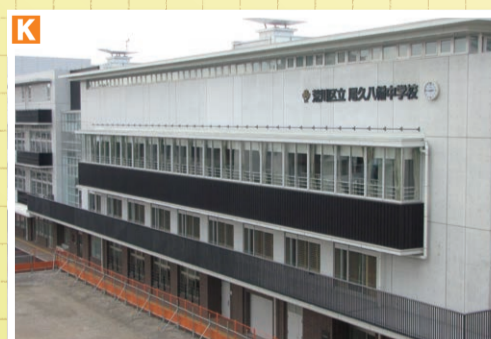
▶尾久八幡中学校の 新校舎