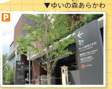
▼ゆいの森あらかわ