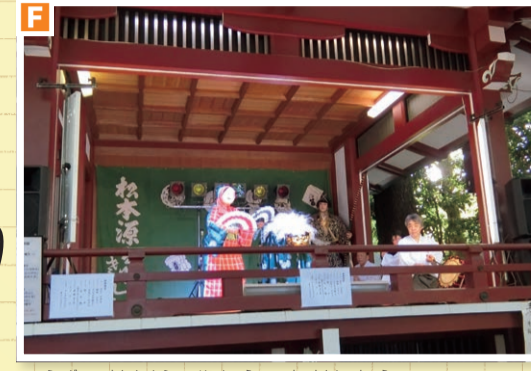
▲江戸の里神楽を継承する松本社中のみなさん