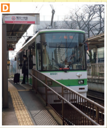
▶都電荒川線の「荒川一中前」停留場