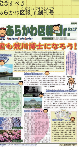
▼記念すべき あらかわ区報Jr.創刊号