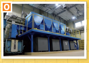
▲あらかわリサイクルセンター