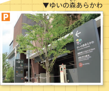
▼ゆいの森あらかわ