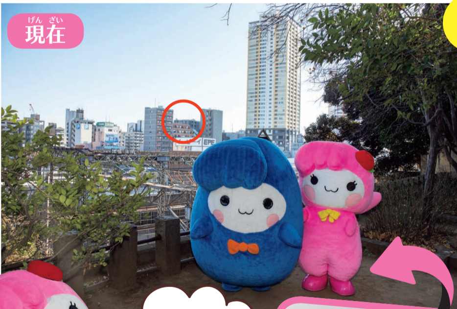
げん ざい 現在