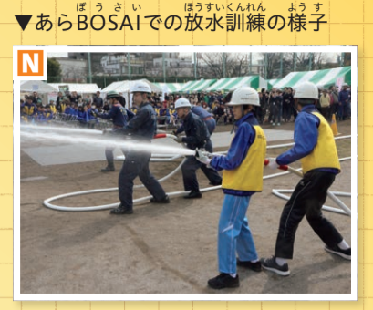
▼あらかわBOSAIでの放水訓練の様子