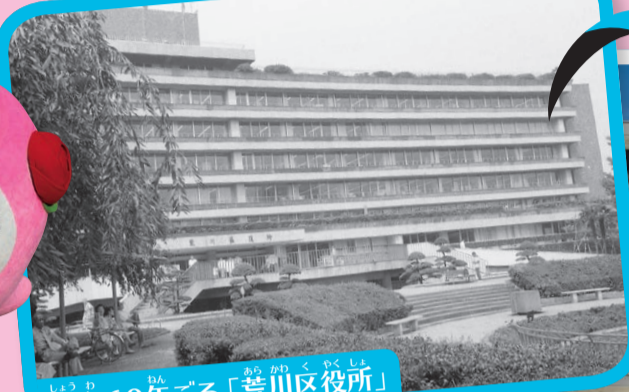
昭和60年ごろ「荒川区役所」