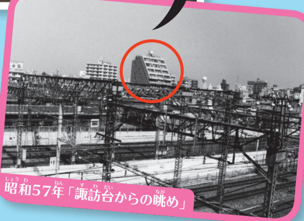
昭和57年「諏訪台からの眺め」