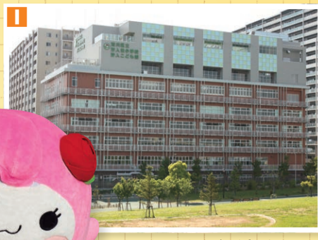
▲汐入東小学校 (汐入こども園併設)