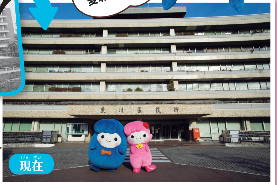
げん ざい 現在