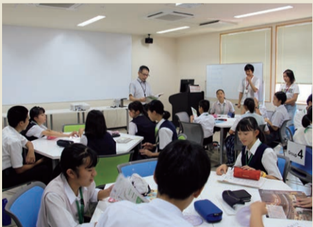
▲グループごとに英語で授業

8月3日～6日、秋田市で区内の中学2・3年生対象の中学校ワールドスクールが行われました。生徒たちは、国際教養大学の「イングリッシュ・ビレッジ」プログラムに参加し、自分たちの英語力を生かした効果的なプレゼンテーションやコミュニケーションの方法を留学生や大学院生から学びました。また、秋田市の協力で枝豆収穫の農業体験や市内観光などを行いました。参加した生徒たちは、英語について興味・関心を高めたり、自然体験や文化に親しむ貴重な体験をしました。