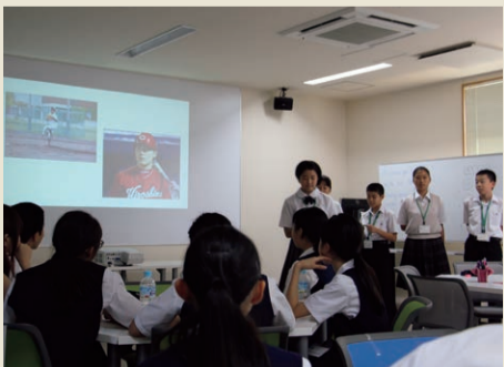
▲英語でのプレゼンテーションも行いました