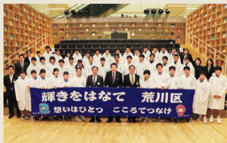
▲おそろいのベンチコートを着て活躍を誓う選手団