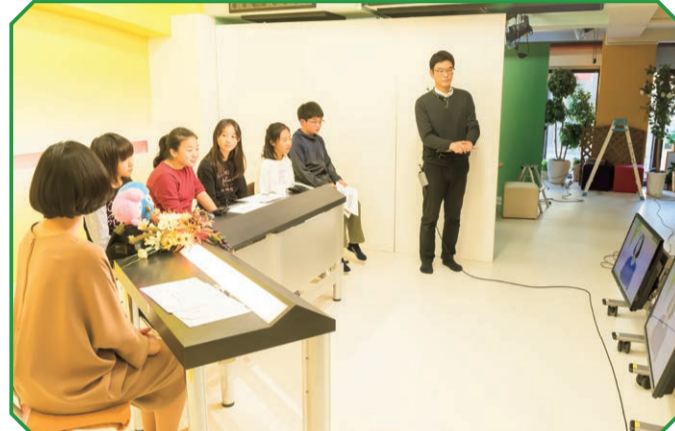
「荒川区行政ナビ」が流れる画面を真剣に見つめます