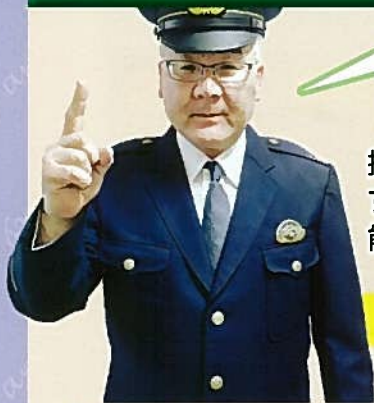
尾久警察署 三上生活安全課長

防犯カメラ以外の対策としては『窓の補助錠』、『センサーライト』、『防犯フィルム』などの活用が有効です。