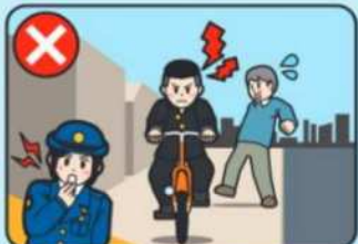
徐行せずに歩道通行