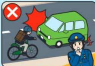
車道の右側通行(逆走)