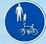
自転車及び歩行者専用の標識

自転車は、歩道の中央から車道寄りの部分を徐行しなければならず、歩行者の通行を妨げるときは、一時停止しなければなりません。