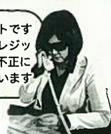
ニセデパート店員

ご安心下さい! 不正使用されたカードを私に頂き、暗証番号を教えてください。暗証番号を教えずに、損害は防止できます!