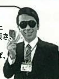
ニセ全国銀行協会

ご安心下さい! 不正使用されたカードを私に頂き、暗証番号を教えてください。暗証番号を教えずに、損害は防止できます!