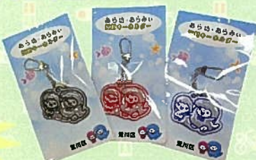
あら坊・あらみ反射キーホルダー