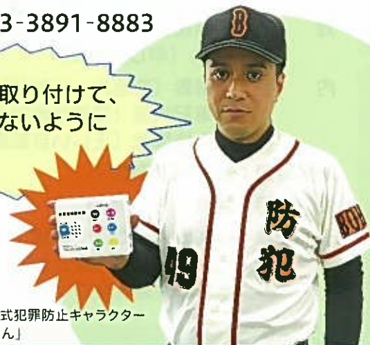
荒川区公式犯罪防止キャラクター 「クロちゃん」