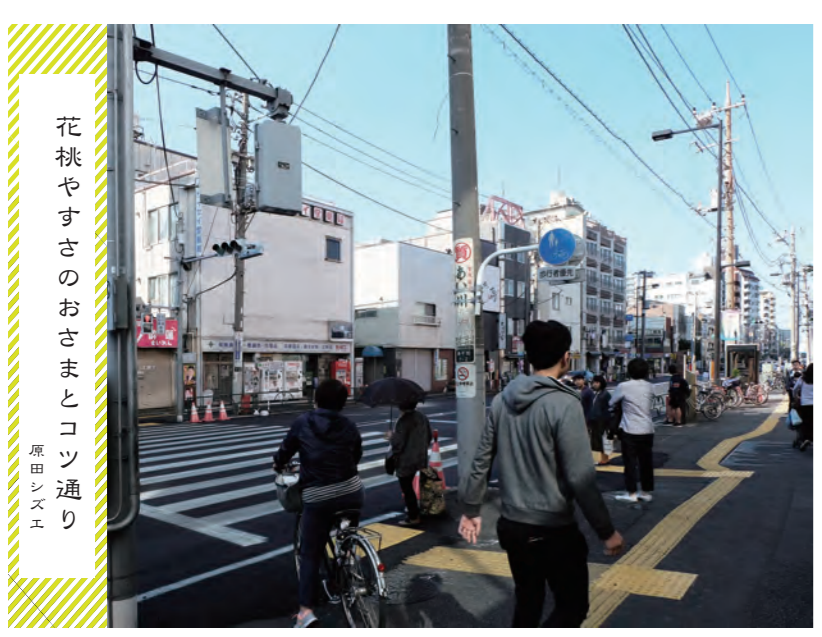
日光街道の宿場町として賑わったコツ通り

砂尾堤の桜、コツ通りの桃、というように、街路樹の樹種を指定することで、通りにテーマを設ける事例が散見され、通りごとに特徴的な景観をつくり出している。 砂尾堤の桜、コツ通りの桃、というように、街路樹の樹種を指定することで、通りにテーマを設ける事例が散見され、通りごとに特徴的な景観をつくり出している。