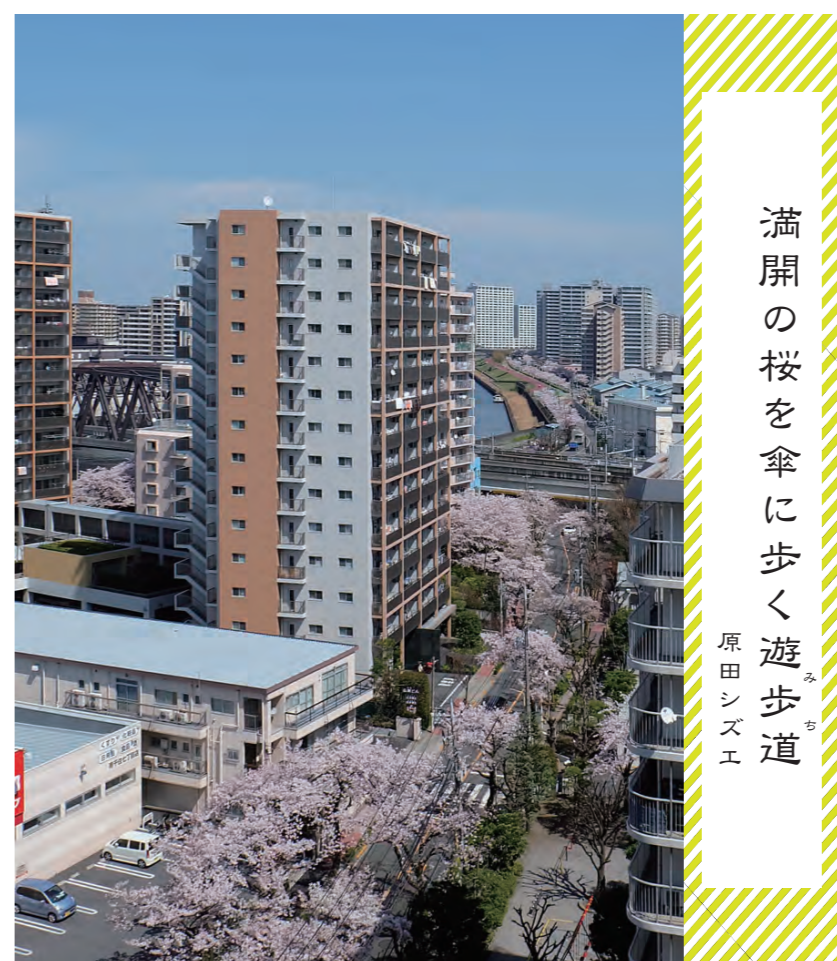
満開の桜を傘に歩く遊歩道