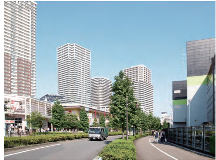
平成エリア：高層マンションが並ぶ

江戸エリア：住宅街を走る都電荒川線、これらを物語の中心として、南千住の街を捉え直す。