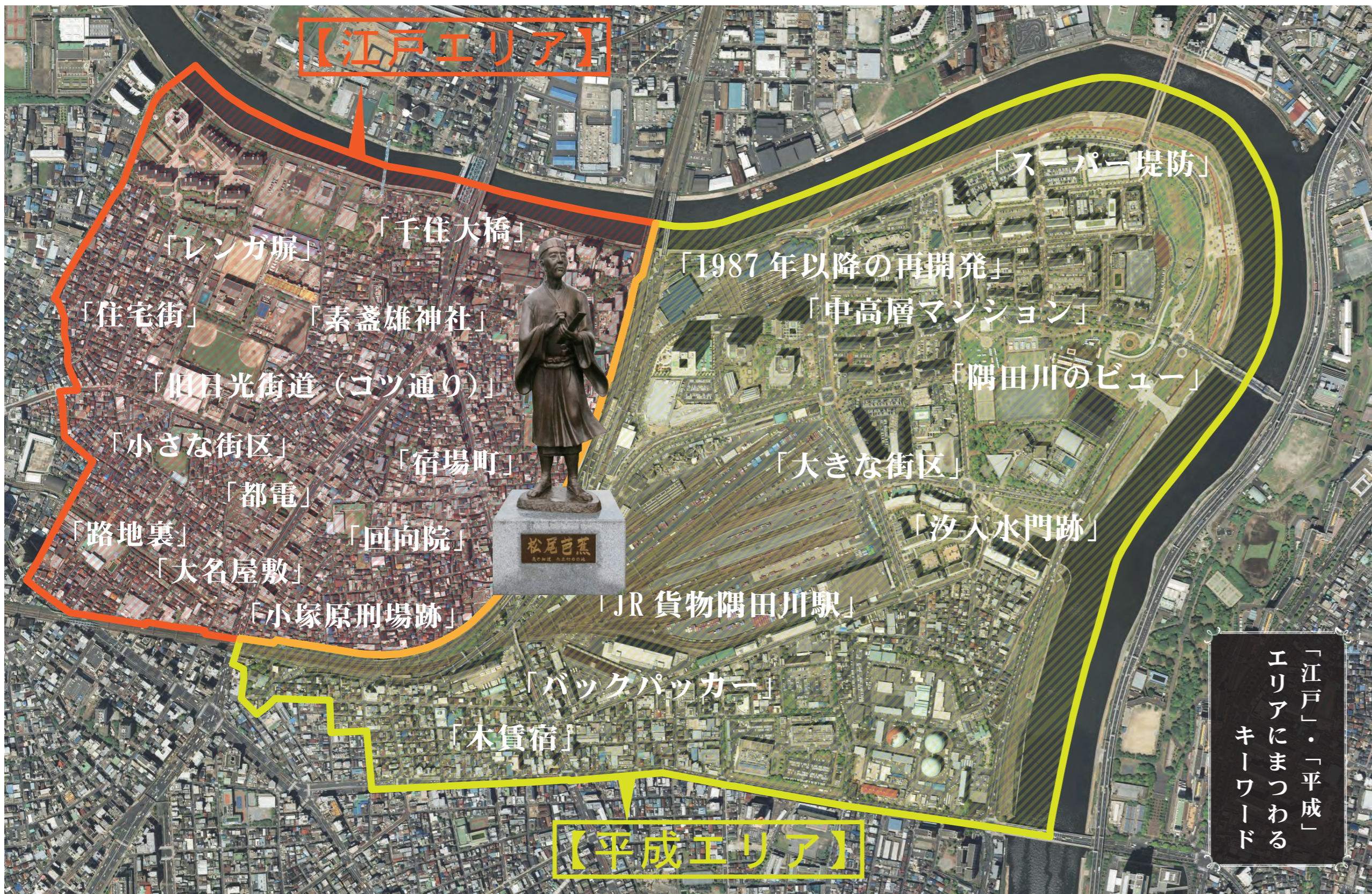
「江戸エリア」と「平成エリア」、両方をまたぐように建つ松尾芭蕉像、南千住の航空写真