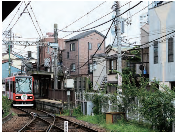
江戸エリア：住宅街を走る都電荒川線