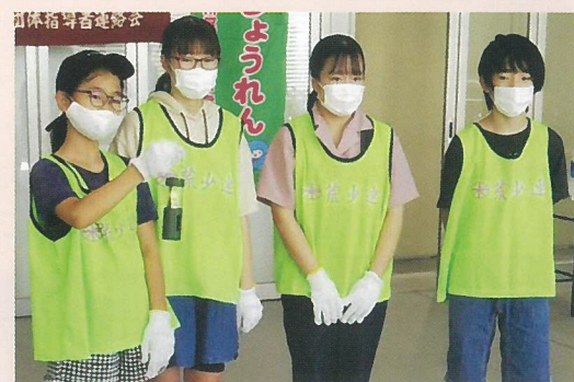
ランタンに移された火

聖火の点火は、「まいぎり式」という方法で行いました。板の上に棒を立て、ひもを棒にまきつけ、はずみ板を上下にうごかして、棒と板の摩擦で熱を伝え火種が生まれます。その火種を燃えやすい木くすなどに移して空気を入れると、火が着く、という方法です。