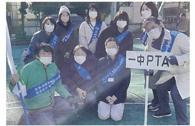
社明パレードに参加

しかし、これをチャンスと考え、これまでのやり方にとらわれないやり方を築いていけたらと思います。