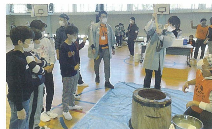
みんなでもちつき

ちなみに、今年度も六瑞パパの会主催の花火大会は、盛大に開催されました。子どもたちだけでなく、保護者の皆様にも喜んでもらい、大変うれしく思います。近隣の方々にはご迷惑をお掛けしておりますが、いつも寛大な心で見守っていただき有難うございます。六瑞パパの会はこれからも子どもたちの笑