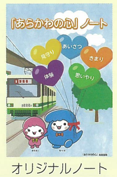
オリジナルノート

アンケート ①このニュースはどこで手に入れましたか。 ②もっとも興味・関心をもった記事は何ですか。 ③その他、ご意見・ご感想等がありましたら、お願いします。