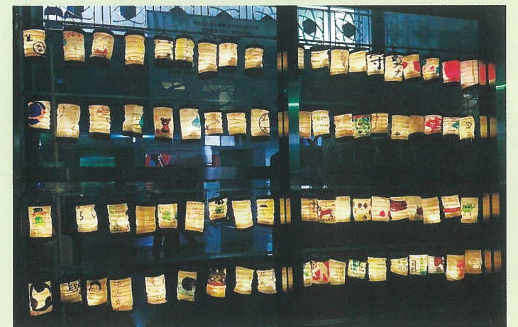
展示されたちょうちん