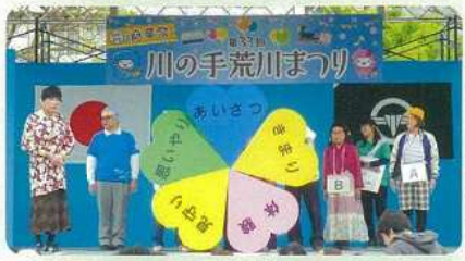
▲ハートマークが合体!

平成31年4月29日(月・祝)、都立汐入公園にて第33回川の手荒川まつりが開催されました。「あらかわの心」推進運動区民委員会では、ステージにて寸劇「カルタ編」を上演するとともに、ブースの出展を行いました。寸劇は、「あいさつ、きまり、思いやり、体験、見守り」という3つのテーマのもと、対照的な行動をするA君とB子ちゃんのとちらの行動が正しいか、会場の観客に答えてもらう参加型の寸劇です。終盤にはシンボルマークであるハートマークも登場し、観客の皆さんに楽しんでいただきました。