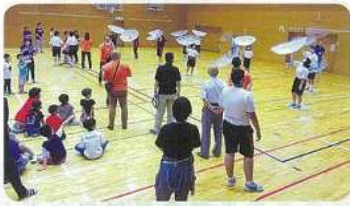
▲親子で楽しめました

アンケートでは「楽しかった・また参加したい」との声も多く、子どもたち同士つながりや、地域との関わりが持てる場所があるのは大事なことだと実感しました。