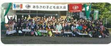
▲みんなで記念撮影

この大会では、6名1チームとなり、こま図と言うシンプルな図形で次の行き先を示して移動します。それにゲームやクイズなどを交えて、考え助け合いながら協力して行う、ウォークラリーです。改装前のあらかわ遊園を脳裏に焼き付け、みなさんの心の1ページになればと思います。当日は快晴で、参加者も大変楽しんでいました。ゴールは少し離れますが、尾久西小学校でした。芝生の素晴らしい景色の中、参加者とお弁当をいただきました。最後の式典は、各チームが頑張った結果発表です。