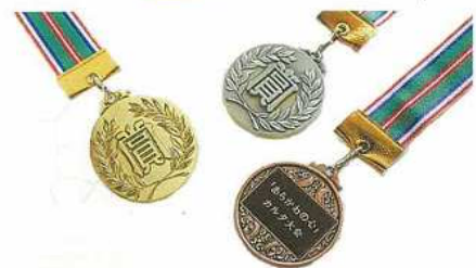
▲メダルを目指して挑戦してね

「荒川は笑顔とあいさつにあう町」から始まるオリジナルのカルタを使用して順位を競う「あらかわの心」カルタ大会を、今年度も開催します。 このカルタ大会には、「試合開始時に手は膝の上」「お手つきは頭の上に手を置いて一回休み」などのルールがあり、楽しみながら、ルールを守ることの大切さを学ぶことができます。 今年で11回目を迎えるカルタ大会は、来年2月に開催予定で、入賞者にはメダルの授与があります。 申し込みは、12月からの予定です。詳しくは、区報等でお知らせします。 また、10月～11月に開催される、各地区のこどもまつりの「あらかわの心」推進運動区民委員会ブースでもカルタを実際に楽しむことができますので、ぜひいらしてください。