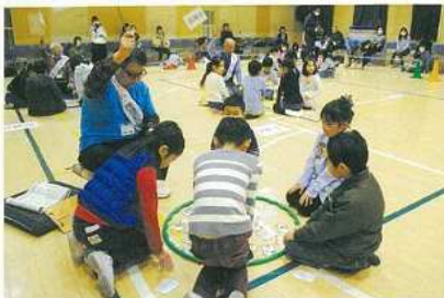
▲第10回カルタ大会の様子