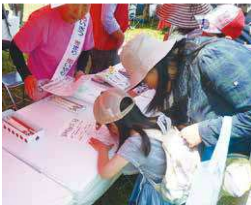
親子でカルタクイズに挑戦中

寸劇の後には、「あらかわの心」の内容が詰まった歌「荒川家の朝ごはん」を歌った後、取り組みが書かれた5つのハートマークを合体させ、シンボルマーク