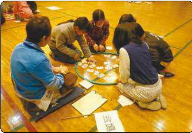
第9回カルタ大会の様子