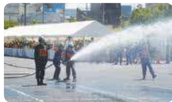
消防操法審査会の様子