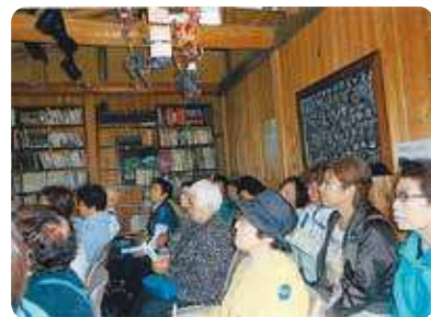
貴重なお話を伺いました

私共の会活動の大きな柱の一つが被災地への支援です。活動当初は東北地方に物資をお送りさせて頂きました。翌年からは訪問活動に変わり、以後毎年実施しております。