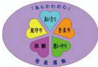
「あらかわの心」推進運動 シンボルマーク

今号では、川の手荒川まつりでのPR活動の様子や、参加団体の活動報告についてお届けします。