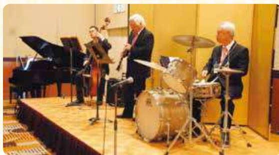
素晴らしい演奏でした

平成30年6月16日（土）、ホテルラングウッドにおいて創立20周年記念総会・祝賀会を開催いたしました。