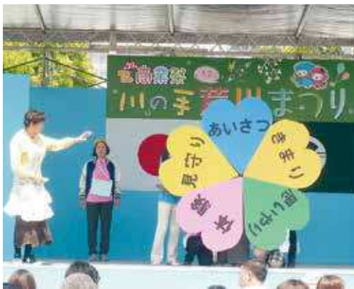
ハートマークが合体！