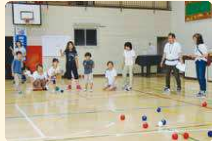
ボッチャを楽しみました

平成30年7月7日（土）、第三日暮里小学校体育館にて、青少年委員日暮里ブロック主催で第16回わくわくランド「パラリンピック ボッチャを楽しもう！」を開催しました。