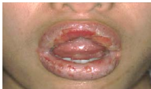
写真2 口唇腫脹と口唇及び口唇粘膜の発赤・びらん