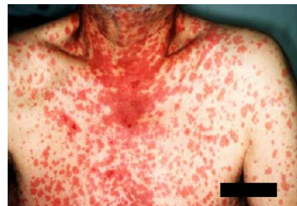
写真3 体幹の浮腫性赤斑と水泡・びらん