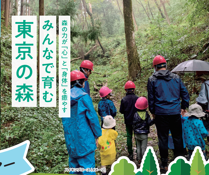
ハイキングコース (イメージ)

かぜ こ 風の子 たい よう こ ひる ば 太陽の子広場 Taiyonoko Square