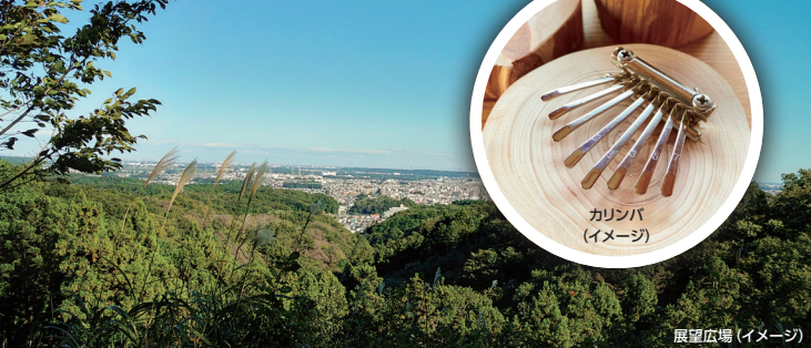
カリンバ (イメージ)