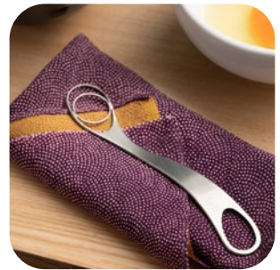
□過去の東京 TASK デザイン交流会（デザイン相談）で生まれた商品