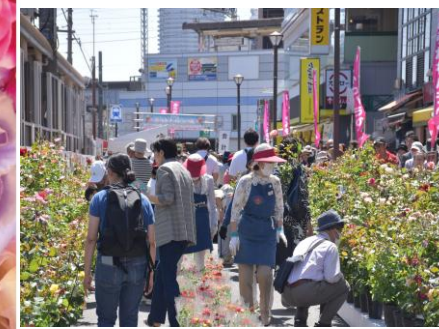
過去のバラの市の様子