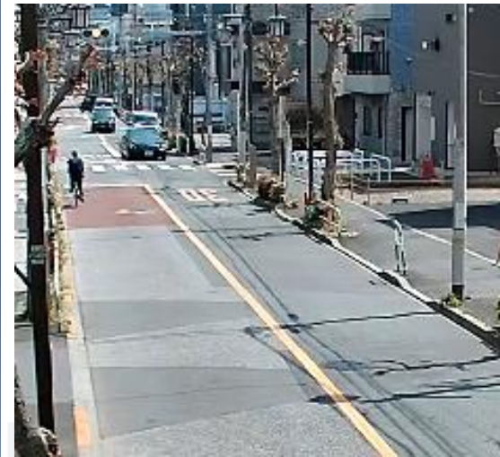
【防災カメラの映像】