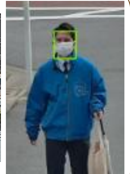
【AI防犯カメラの映像】