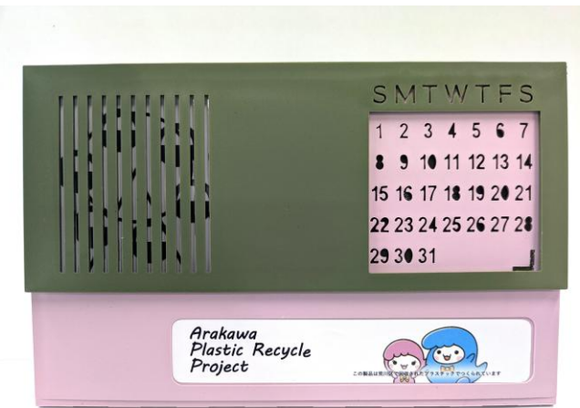
完成した万年カレンダー

この取組みは、「プラスチックの区内循環利用(地捨地消)」として、環境省公募「令和7年度プラスチック資源循環に関する先進的社会的実装モデル形成支援事業」で採択！