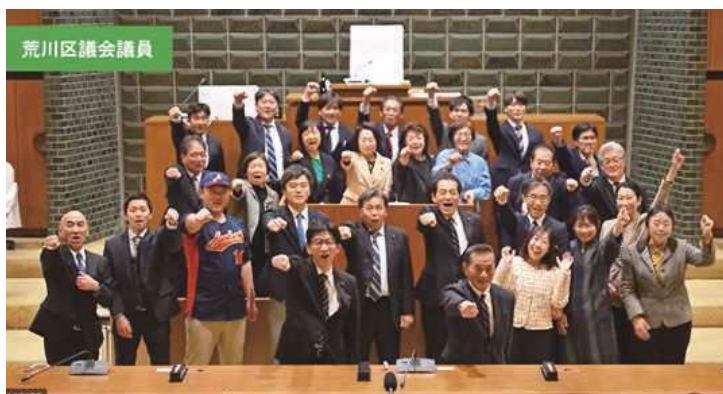
荒川区から世界へ！鈴木誠也選手を応援しています！

荒川区議会は、これからも当区とゆかりのある鈴木誠也選手のご活躍を応援しています！