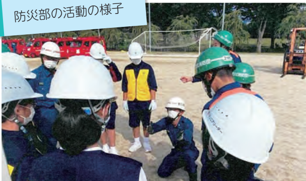
防災部の活動の様子

視察に訪れた議会からは、活動内容や地域連携、災害対応等について質疑が行われました。