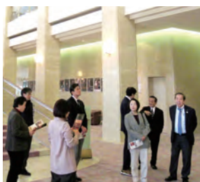
◀行政視察（ふくやま芸術文化財団）