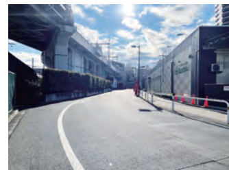
◀南千住駅前の 中道区道

答 沿道の事業者や南千住警察とも協議を行ったうえで、実証実験としてイベント等による道路空間の暫定活用を行うなど、賑わい創出の場として持続的に活用されるよう、更なる検討を進めていく。