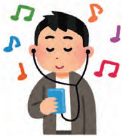
▲イヤホン難聴の注意喚起

問 大音量による聴力低下、イヤホン難聴に関する現状認識や啓発活動の取り組み状況を問う。また、若年層を含めた早期発見・啓発の取り組みをどのように進めていくのか、区の見解を問う。