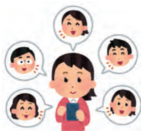
▲インスタグラム等を活用した魅力発信

答 基本構想ワークショップにおいて区民の皆様からご意見を伺い、荒川区地域経済活性化及び観光プロモーション推進協議会においても活発な議論が展開されている。今後、インスタグラムの活用を中心に、区の温かみある魅力を広く伝えていく。