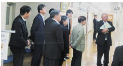
◀行政視察(東成瀬村)