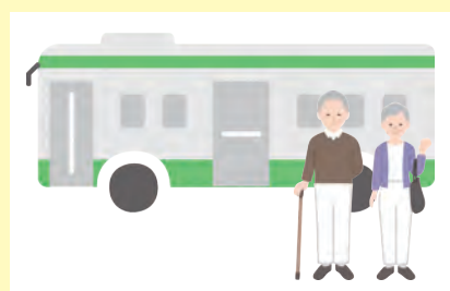
シルバーパスの無償化 を実施

結びに、本年が区民の皆さまにとりまして健康で希望に満ちた一年となりますよう心よりお祈り申し上げます。