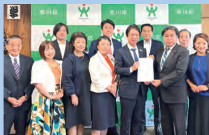
524項目にわたる 予算要望書を提出

私たち自民党は、昨年結党70年を迎え、体制も新たになりました。長引く不況の中、今こそ国民政党としての原点に立ち返り、今の暮らしや未来に希望を持てるような政治を行ってまいります。