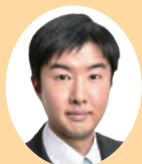
㊟ くげ しげる 久家 しげる