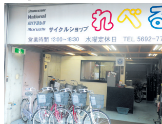
サイクルショップも運営