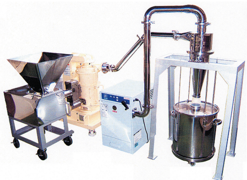
MCM-3 ニューマイクロシクロマット

近年は、既存製品に加え新分野の粉体（食品、薬品、新素材関連等）のニーズにもマッチする製品の研究・開発に傾注し、新たな微粉碎システムの販売に力を入れている。また、販売方法についてもホームページやイプロス等のポータルウェブサイトの活用を推進している。