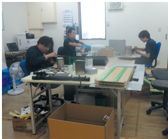
手作業が欠かせない蛇腹づくり

広範なジャンルで使われる蛇腹だが、ハセジャバが力を発揮するのは工作機械などの駆動部分をカバーする蛇腹だ。機械を動かすためのボールねじやリニアガイドは、裸のままでは粉塵や切り粉が付いて、動作不良につながりかねない。そこで“動くカバー”としての蛇腹が不良防止などで大きな役割を担うことになる。