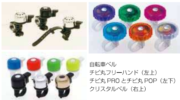
自転車ベル チビ丸フリーハンド（左上） チビ丸PROとチビ丸POP（左下） クリスタルベル（右上）