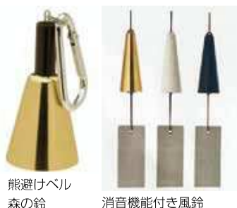
熊避けベル 森の鈴 消音機能付き風鈴

また、開発会議にて提案・開発された「熊避けベル 森の鈴」は、本体を上下に引くことで簡単に音をon/offできる機能を付加し、登山への移動中などにベルがうるさいという登山者の悩みを解決した。同製品は、