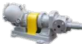
MC型 ギヤードモーター直結式

時間操業を行う企業からの注文も多い。今後は、更に飛躍するため、シールレスギヤポンプの研究を重ね、耐熱化・更なる高圧化・大型化といった改善を果たし、より技術開発力を向上させていく。