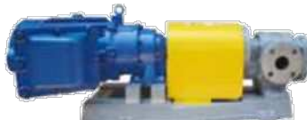
MC(微量)型 カップリング直結式

製品づくりは、本社工場と埼玉工場で機種を分担して生産している。ギヤポンプは多品種少量の宿命にあるが、専門・集中生産を行って効率化し、工場の稼働率は高い。主力製品は、「シールレスギヤポンプ」である。液漏れのしない完全密閉式であることが特徴の新製品で、発売と同時にヒットし、一躍主力製品に躍り出た。完全密閉なので、環境に優しく、危険物移送などにも適している。また、従来品には必須であった、シール（液体や気体を外部に漏らさないようにする部品）を無くす構造を構築しているため、シールを交換する手間が省けることも特徴で、24