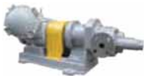
MC型 ギヤードモーター直結式

時間操業を行う中国企業などからの注文も多い。今後は、更に飛躍するため、シールレスギヤポンプの研究を重ね、耐熱化・更なる高圧化・大型化といった改善を果たし、より技術開発力を向上させていく。