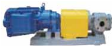
MCX 微量型 カップリング直結式

製品づくりは、本社工場と埼玉工場機種を分担して生産している。ギヤポンプは多品種少量の宿命にあるが、専門・集中生産を行って効率化し、工場の稼働率は高い。主力製品は、「シールレスギヤポンプ」である。液漏れのしない完全密閉式であることが特徴の新製品で、発売と同時にヒットし、一躍主力製品に躍り出た。完全密閉なので、環境に優しく、危険物移送などにも適している。また、従来品には必須であった、シール（液体や気体を外部に漏らないようにする部品）を無くす構造を構築しているため、シールを交換する手間が省けることも特徴で、24