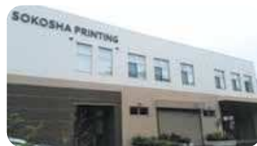
壮光舎印刷株式会社 本社