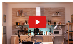
YouTubeチャンネル動画制作の事例