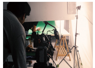
自社スタジオでの写真・動画撮影風景