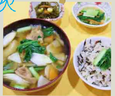
三河島菜入りすいとんと 三河島菜のみじきご飯