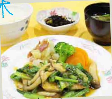
三河島菜と豚ヒレのステーキ風茸ソース