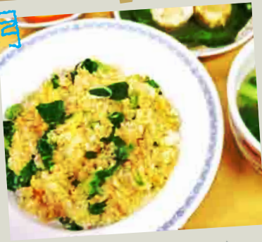
三河島菜炒飯と点心