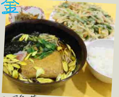
三河島菜入りかき揚げと 菊花あんかけそば