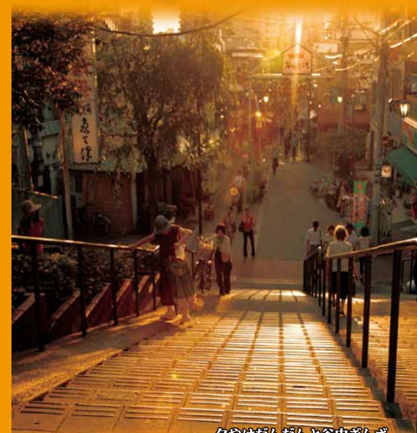
タヤけだんだんと谷中ぎんざ