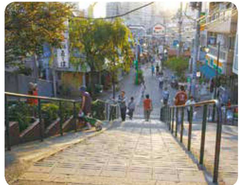
⑥ 유야케단단과 아나카 긴자 (니시닛포리 3초메~다이토구 아나카 3초메 부근)

'유야케단단'은 아름다운 노을을 감상할 수 있는 계단으로, 일본 공모에 의해 명명되었습니다. 레트로 분위기가 감도는 아나카 긴자(아나카 긴자 상점가)의 가게 앞 지붕 위에는 고양이 오브제(나무 조각)가 장식되어 있으니 한번 찾아보시기 바랍니다.