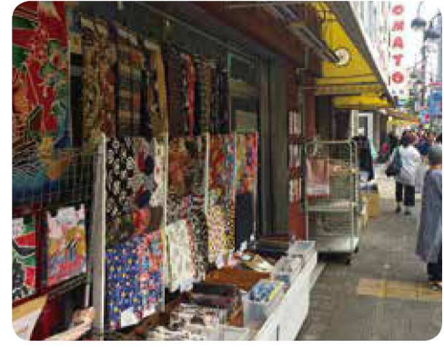
③ 닛포리 섬유 거리 (히가시닛포리 3~6초메 부근)

닛포리역 동쪽 출구 로터리에 있는 오타 도칸 동상은 승려이자 조각가였던 하시모토 가쓰도 씨에 의해 제작되었습니다. '황매화 가지' 동상은 '황매화의 마을 전설'에서 도칸에게 황매화 꽃을 바친 여성에 대한 모상을 표현한 작품으로, 조각가 히라노 쉐리 씨에 의해 제작되었습니다.