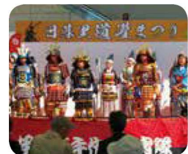
닛포리 도칸 축제 (닛포리역 앞 이벤트 광장)

오타 도칸은 무로마치 시대 후기부터 전국 시대 초기에 활약한 무장으로, 에도 성을 지은 것으로 알려져 사람들에게 사랑 받아 왔습니다. 도칸은 아라카와구에 있는 니시닛포리 4초메 부근에 요새를 세운 것으로 알려져 있으며, 니시닛포리역 북서부의 높은 지대 일대는 도칸산이라고 불립니다. 닛포리 도칸 축제에서는 오타 도칸 연고지의 지자체와 점포의 제품 판매, PR 등이 이루어집니다. | 개최시기 | 11월