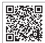
◀ 荒川区新庁舎整備基本方針