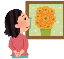
芸術文化振興プラン(第四次)の素案が完成