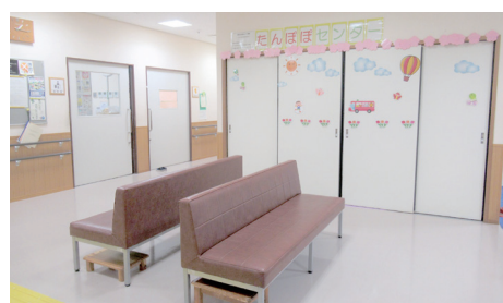
▲荒川区立心身障害者 福祉センター （たんぽぽセンター）