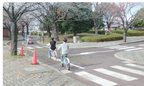
▲荒川自然公園 交通園