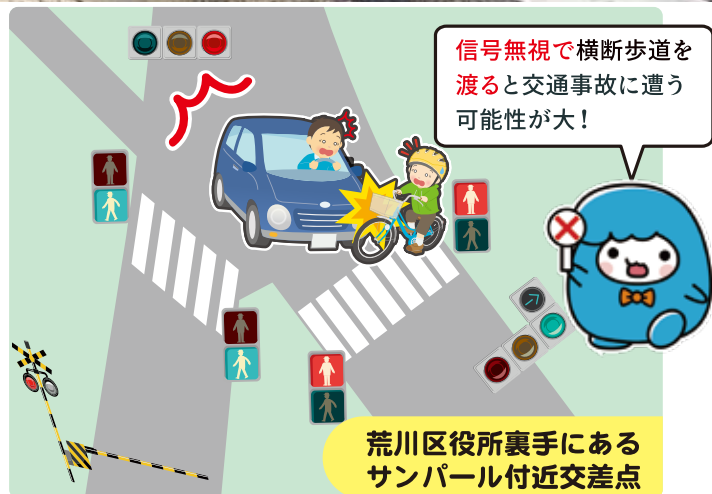
荒川区役所裏手にある サンパール付近交差点