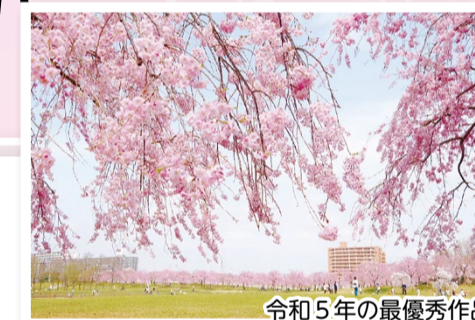
令和5年の最優秀作品

応募方法 持参・郵送・下記ホームページ(右の二次元コード)で、応募用紙と写真(カラープリント四つ切りまたはA4サイズ)を、〒116-8501(住所不要)尾久の原公園シダレザクラの会事務局(土木管理課内)☎(3802)4483 📧 https://logoform.jp/form/bUir/424073