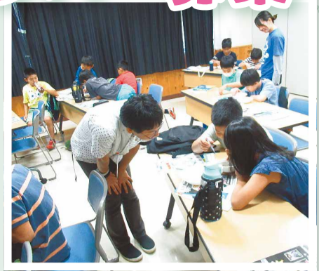
◀ワークショップの様子