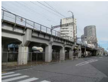
◀京成電鉄のガード下(花の木交差点付近)

答 荒川2丁目・7丁目の下水は、将来的には東尾久浄化センターに流れることになる。この地域の臭気問題の解決のためにも、下水道局に対しこれまで以上に積極的に再構築等を推進するよう働きかけていく。また、高架下利用は、地域の活性化や防犯性、景観の向上にも寄与するので、引き続き高架下を管理する京成電鉄と検討していく。