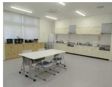
↑ 調理・会議室 (東尾久本町通り ふれあい館)

問 地域で子どもを守り育てる場所を1カ所でも増やすため、今後整備するふれあい館には、子どもの居場所や子ども食堂として活用できるよう調理室を完備することを要望するが、見解を問う。