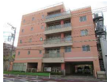
▲グループホームを併設している「スプラムあらかわ」

答 関係事業者や土地所有者と協議を進めており、引き続き早期設置に向け取り組んでいく。