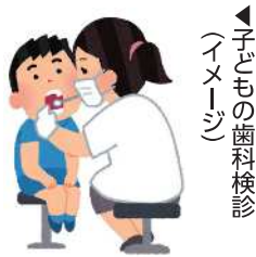
子どもの歯科検診 (イメージ)

答 歯と口、身体の健康づくりを乳幼児期からスタートさせることは大変重要であると考えており、認証保育所における補助について検討している。