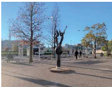
◀現在のドナウ広場

答 中道区道については、歩行者が滞在する空間への転換を図るため、歩きやすい道づくりの検討を進めている。また、補助第331号線の開通に伴い、道路の利用形態が大きく変わる可能性があることから、ドナウ広場の活用方法も考えていく必要がある。中道区道がドナウ広場とともに南千住駅東側の周辺の賑わい創出に寄与できるよう、効果的な活用方法について鋭意検討していく。