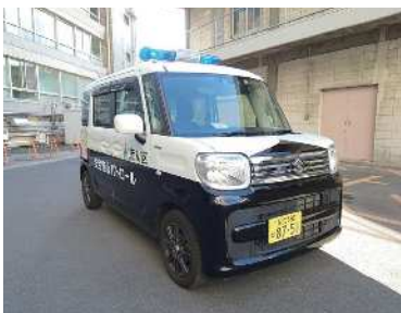
▲安全・安心パトロールカー (通称青パト)

答 自転車の交通ルール等を区報等で周知しているほか、青パトの巡回時に自転車のルール違反を見かけた際には注意を呼び掛けている。また、自転車走行空間の整備等、ハード面での対策にも取り組んでおり、今後もより一層推進していく。