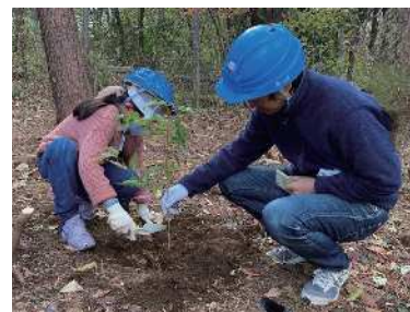
◀自然体験事業(あらかわの森植樹ツアー)

問 自然体験や子ども向けの文化・芸術に係る体験型プログラムについて、充実・拡充を図ること。