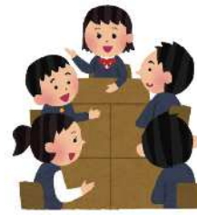
将来の有権者である 子どもたちの政治参加を