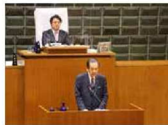
11月会議における区長答弁の様子