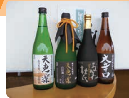
よしかわ杜氏自慢のお酒です

北陸新幹線を利用して東京から上越市まで最短1時間49分で結ばれています。上越市吉川区は、酒蔵職人の杜氏が多く、地元の酒米と水で仕込んだうまい地酒と四季折々の豊かな自然が魅力です。ぜひ、お越しください。