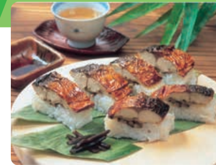
福井県名物「焼き鯖寿司」

2024年北陸新幹線福井・敦賀開業！東京から福井まで最短2時間51分。福井県は豊かな自然が育む海・山・里の幸の宝庫です。福井県ブースでは、「食の國ふくい」の恵みを用意してお待ちしております。