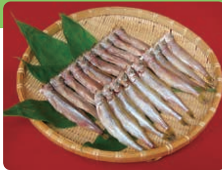
特産品の生干ししゃも

国内唯一のサンタランドのまち・広尾町は、国内有数の水揚げを誇る「本ししゃも」などおいしいものがたくさん！今回もこだわりをもって加工されたおいしい海産物をご用意していますのでぜひお立ち寄りください。