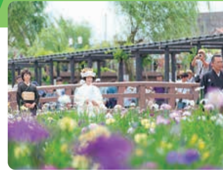
水郷潮来あやめ園

5月17日(金)から6月16日(日)まで「第73回水郷潮来あやめまつり」が開催され、約500種100万株のあやめが一面に咲き誇ります。期間中は「嫁入り舟」や「る舟遊覧」等水郷ならではのイベントが盛り沢山です。