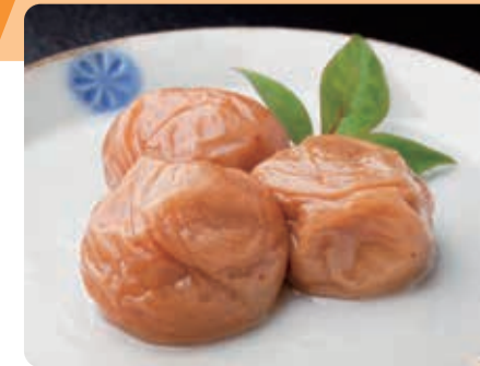
紀州みなべの南高梅

日本一の梅の町みなべ町は南高梅誕生の地でもあります。400年前から続く梅システムはFAOから世界農業遺産に認定されています。また2月には梅の花が咲き誇り、観梅客で賑わいます。