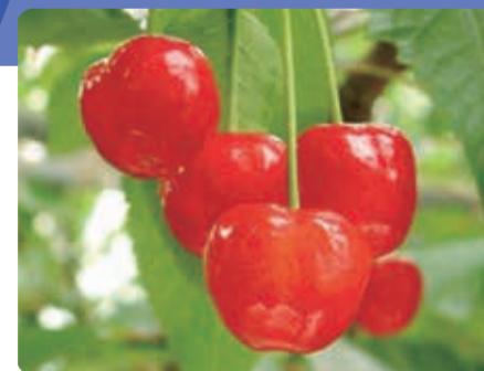
初夏の味覚「さくらんぼ」

フルーツ王国南アルプス市は、5月初旬のさくらんぼを皮切りに、桃・すもも・ぶどう・柿・莓など1年を通してもぎたての美味しい果物が楽しめます。南アルプス山麓に位置する南アルプス市にぜひ遊びに来てください。