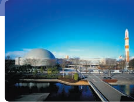
つくばエキスポセンター

つくば市は、中心部に筑波宇宙センター等の世界有数の研究施設が立ち並び、周辺部には筑波山や豊かな自然が広がっています。南千住からTXで約40分の自然と科学が調和したまち「つくば」にぜひお越しください。