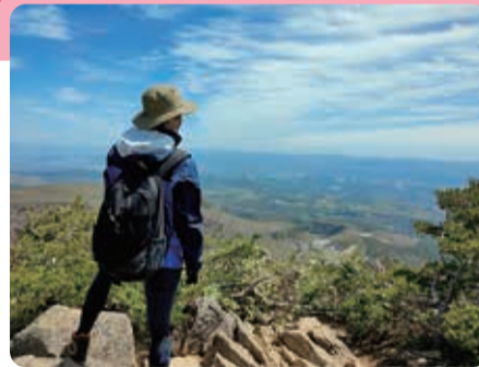
日本百名山「安達太良山」からの眺望

春は桜、夏は登山、秋は菊人形や提灯祭り、冬はスキーや温泉と四季ごとに魅力溢れるまちです。今回も減農薬にこだわった里山のげんきな野菜と農産加工品をご用意しました。ぜひ、二本松市ブースへお越しください。