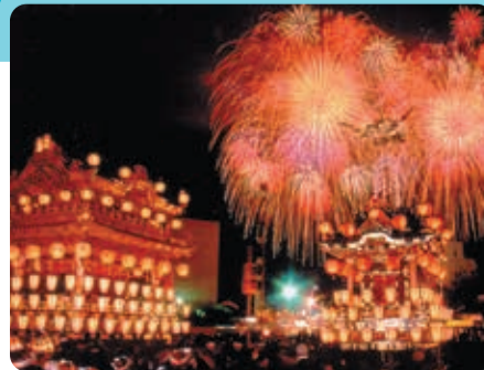
幻想的な冬の火花と山車

埼玉県の北西部に位置する秩父市は、都心から電車で約80分でお越しいただける、自然豊かなまちです。毎年12月2・3日には、日本三大曳山祭り「秩父夜祭」を開催しております。ぜひ、秩父にお越しください。