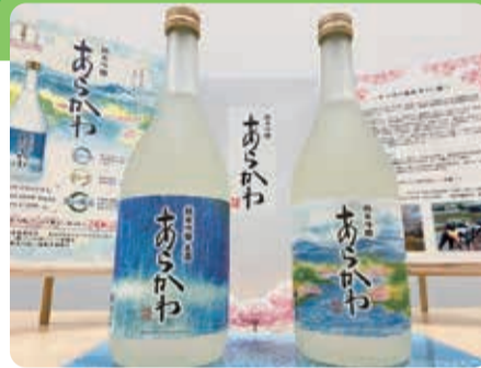
すっきりとした味わいが特長の日本酒

福島市と荒川区は共同で田植え、稲刈りを行い、受賞歴多数の福島市の金水晶酒造店で「純米吟醸あらかわ」を醸造しています。この日本酒に加え、絶品ワインと市自慢の特産品をご用意していますので、ぜひご堪能ください。