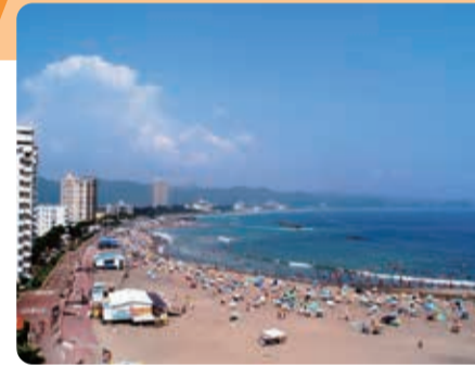
日本の渚百選「前原横濱海岸」

千葉県鴨川市は、房総半島南部に位置し、温暖な気候に恵まれた自然豊かな観光リゾート都市です。当日は、房総の春を満喫できる山菜や夏みかん、フルーツトマト、切花などをご用意しています。是非、お立ち寄りください。