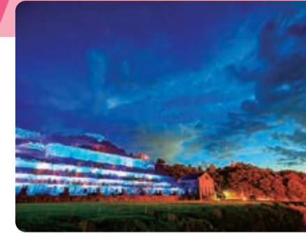
北沢浮遊選鉱場跡ライトアップ

日本海側最大の離島「佐渡島」には魅力がいっぱいです。四季折々の豊富な魚類、自然界に500羽以上生息するトキと共生する農業で作られた美味しいお米があります。世界遺産登録目前の佐渡へお越しください。