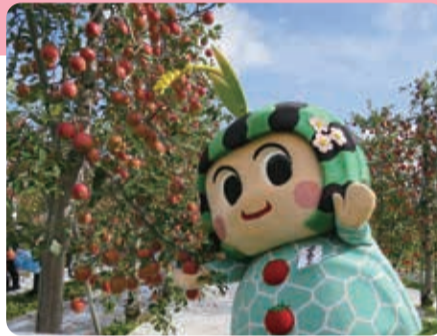
つがる市マスコット つがるちゃん

青森県つがる市には、遮光器土偶(重要文化財)が出土した亀ヶ岡遺跡をはじめ、世界遺産登録を目指す縄文遺跡群があります。この縄文ロマンと自然豊かな津軽平野が育んだ優れた品質の農産物をご紹介します。