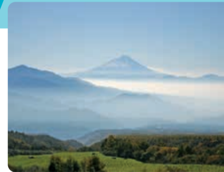
八ヶ岳から望む富士山

山梨県の北西部に位置する北杜市は、周囲を日本を代表する美しい山に囲まれ、清らかで豊富な水資源、日本で一番長い日照時間、歴史的な町並みや滞在型温泉地、高原リゾート地など豊かな資源に恵まれた地域です。