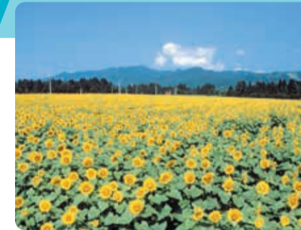
津南ひまわり広場(7月末~8月中旬開園)

日本一の豪雪地、津南町は、夏は50万本のひまわりが咲く「ひまわり広場」、秋は日本の原風景と美しい紅葉が織りなす「秘境秋山郷」、冬は雪原での「スカイランタン打上げ」が特徴の町です。ぜひ遊びに来てください。