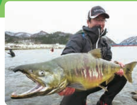
サーモンフィッシング

村上市は新潟県の北端に位置し、自然豊かなところ。当荒川地域では平成の名水百選に認定された「清流荒川」とおいしい「岩船産コシヒカリ」が自慢です。また、冬には清流荒川でサーモンフィッシングも楽しめます。