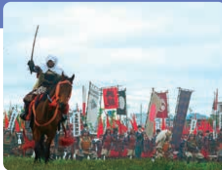
毎年5月3日に開催 米沢上杉まつり川中島合戦

米沢市は山形県の南の玄関口にあり、戦国の名将・上杉謙信や、なせばなるの名言で有名な上杉鷹山に代表される上杉の城下町です。大好評の米沢牛串、牛玉こんにゃくを販売しますので、ぜひ米沢ブースにお越しください。