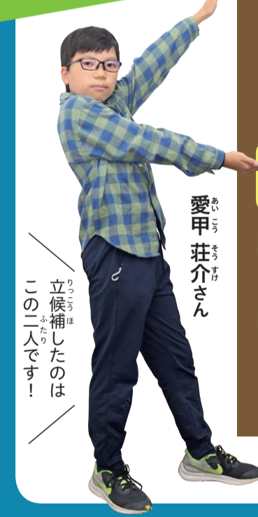
立候補したのは この二人です!

選挙の仕組みや大切さを学んだあとは、本物の投票所と同じ道具を使って投票を行いました。実際の選挙には、衆議院議員選挙や、参議院議員選挙、地方公共団体(都道府県や区市町村)の議員や首長を選ぶ選挙などがあります。