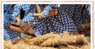
おたたくごんじょうじ 大田区厳正寺に伝わる藁の竜

藁の竜は、姿を消してしまったけれど、周辺が農村だったころのあらかわの歴史を伝えてくれているんだね。えっ! 竜はアニメや昔話などにも登場するし、お神輿や山車にかっこいい竜が彫られているのを見たって? よく観察しているね。神社や寺院、街中を探検するとちょっと竜に出会えるかもしれないよ。みんなで