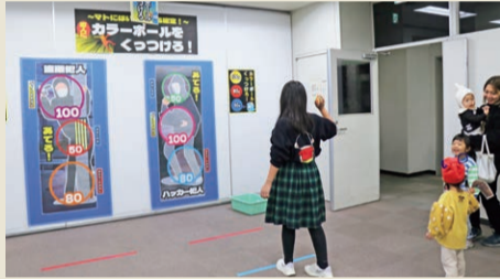
▲カラーボールを犯人に当てよう!

なお、区役所分庁舎入口の「あらかわ安全・安心スポット」では、日ごろから防犯や交通安全の啓発活動を行っています。ぜひ、行ってみてください。