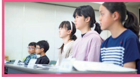
▲「選挙や投票のことを知りたい!」と取材に臨んだジュニア記者たち。真剣な表情で萩野委員長の話を聞いていました