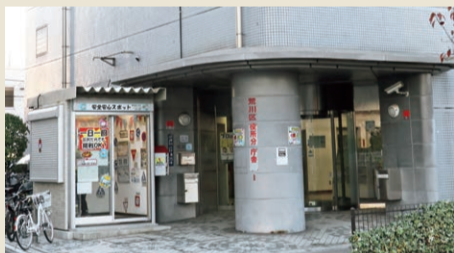
▲安全・安心スポットには(月)~(金)の午前9時~午後5時に遊びに行けます