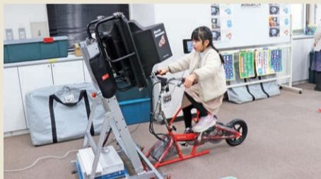
▲自転車シミュレーターで交通ルールを学びました