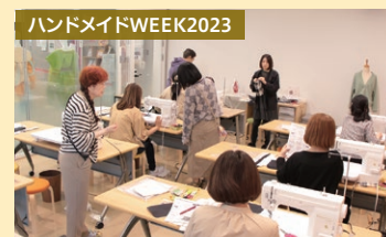
ミシンを使ったワークショップ

公開展示会と同時期にベビーロック・スタジオ日暮里がミシンを使ったワークショップを開催。また、ファッション関連創業支援施設「イデタチ東京」の入居者による展示・販売会「イデタチ東京 POPUP」も行われました。ハギレ・B品の販売が併せて開催され、多くの人で賑わいました。