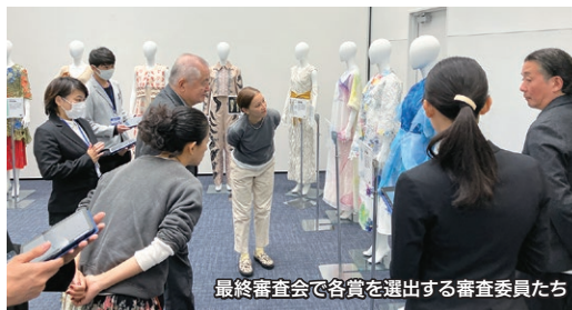
最終審査会で各賞を選出する審査委員たち