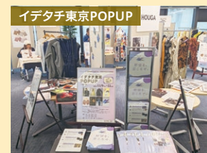
入居者の展示・販売会の様子