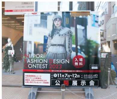
公開展示会では受賞・入選作品がズラリ!