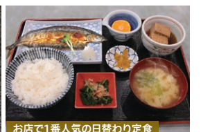
お店で1番人気の日替わり定食

老若男女を問わず、家族連れでも皆が自分の好みを見つけられるようにと考え、常時200種類以上のメニューを準備。市場の仲買人と良好な関係を築き、旬な食材を使った料理を安価で提供しています。日替わり定食は一番人気で90食ほど出る日もあり、酒の肴の一品料理もプラス310円で定食に変更可能。評価サイトでも「安くて美味しい店」として評判です。