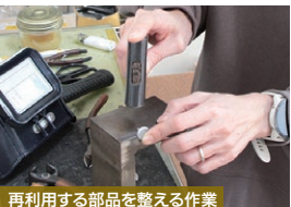
再利用する部品を整える作業