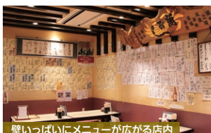
壁いっぱいメニューが広がる店内