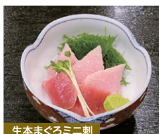
生本まぐろミニ刺