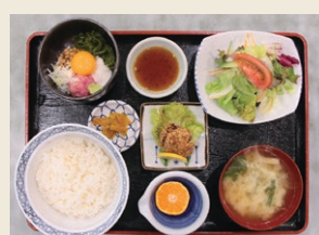
「あらかわ満点メニュー」納豆ネギトロ丼定食

ときわは、荒川区が推進する食環境整備事業の1つである「あらかわ満点メニュー」の提供店です。現在は「納豆ネギトロ丼定食」と「牛肉スタミナ炒め定食」の2つのメニューがあります。女子栄養大学短期大学の皆さんと協力して、エネルギーや食塩相当量、野菜の量などを調整して完成させた、健康に配慮した自慢のメニューです。