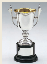
①大型の銀製優勝カップ

銀は加熱すると柔らかくなり、加工しやすくなります。工房にはバーナーがあり、必要な箇所に火を当てて作業を進めます。