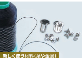
新しく使う材料(糸や金具)