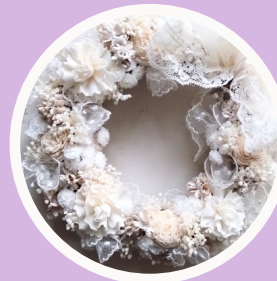
花のはしおき屋 幸 Factory 幸坂木工雑貨店 sowa TORIWREATH A GIFT FROM PLANTS