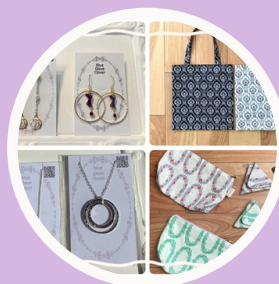
blue glove clover