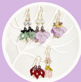
On the Earth