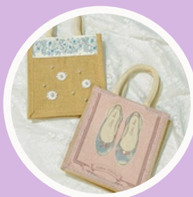
手づくり工房ぼぼ屋 EDEN in bloom LUNA Shanti-macrame NAMIOTO