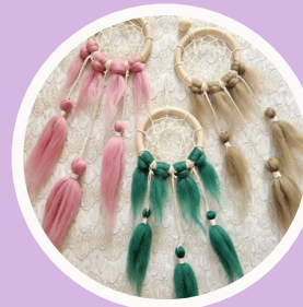
クリスマスショップ Juniper COTTON FACTORY bremen giani_love_macrame