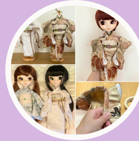
Ramona DENiCLA Lilac craft SHOPmarico green green