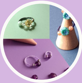
n.beige 或世への死装束 Nocturne 鹿の子 (かのこ)