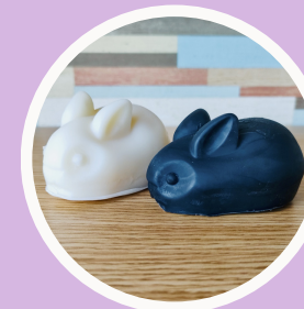
常初花 結丸の水引 UNO handmade accessories k.fabric輪 うさぎ石鹸