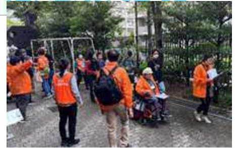
昨年度のユニバーサルウォークの様子

子どもから高齢者・障がいのある人もない人もみんなと一緒に交流しながら「防災」をテーマに歩くウォークラリーです。今回は日暮里地区（日暮里駅周辺）を歩きます。お一人でも、ご家族・ご友人とでもぜひご参加ください。