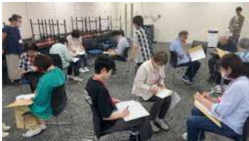
昨年度の講座の様子

「あらんてあ」とは、あらかわのボランティアの造語です。 荒川区内を中心としたボランティア活動の情報やイベント情報、助成金の情報を提供しています。