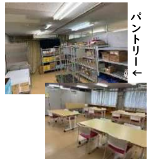
パントリー ランチルーム

新たなスペースとして、1階には食材等を保管する「パントリー」と小さな講座や打合せ、作業等が行える「ランチルーム」が、2階には音楽演奏や大人数でのイベント開催が可能な「多目的ホール」ができました。今後、様々なかたちでボランティア活動を広めていきます。