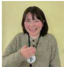
ボランティアセンター 博多 華穂