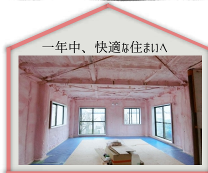
一年中、快適な住まいへ