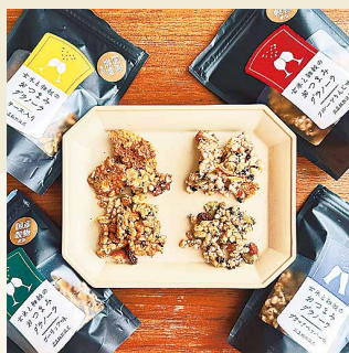
▲おつまみグラノーラ