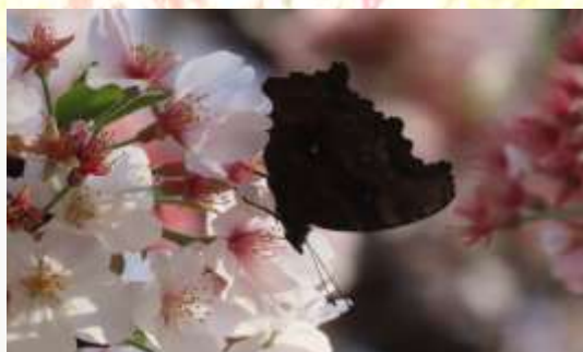
名前：ルリタテハ 様子：ソメイヨシノの花に口吻を伸ばして吸蜜していました。無事に越冬できたのでしょうか。 見つけた場所：エコセンターの桜の木