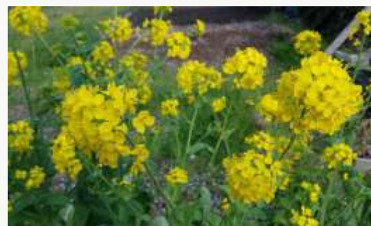
名前：三河島菜 様子：12月の農園講座で育てた三河島菜を種採り用に残した株が人の背丈ほどに育って花を咲かせていました。 見つけた場所：エコセンター農園