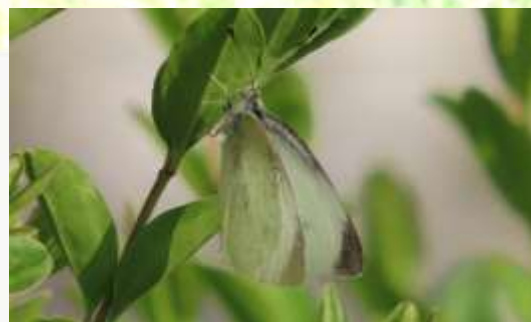
名前：モンシロチョウ 様子：三河島菜などの周りをずっと飛び続けた後、ようやく垣根のイボタノキにとまって休みました。 見つけた場所：エコセンターの垣根