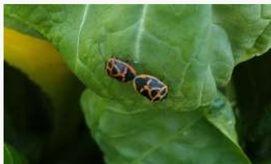
名前：ナガメ 様子：3階のテラスのプランターに植えられている後閑晩生小松菜の葉の上を交尾したまま歩いていました。 見つけた場所：テラスの小松菜