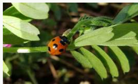
名前：ナミテントウ 様子：ヤハズエンドウの葉や茎を隅から隅まで歩き回っていました。アブラムシを探していたのでしょうか。 見つけた場所：草地のヤハズエンドウ